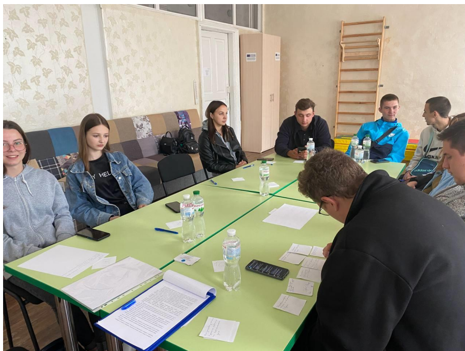
Рисунок Д.1 – Учасники тренінгу за роботою