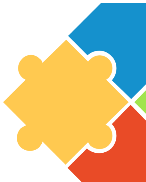
Рисунок Е.1 – Презентація до тренінгу

Всі учасники фокус-групи та інші потенційні споживачі соціальних послуг такого характеру можуть отримати доступ до презентації за даним посиланням: