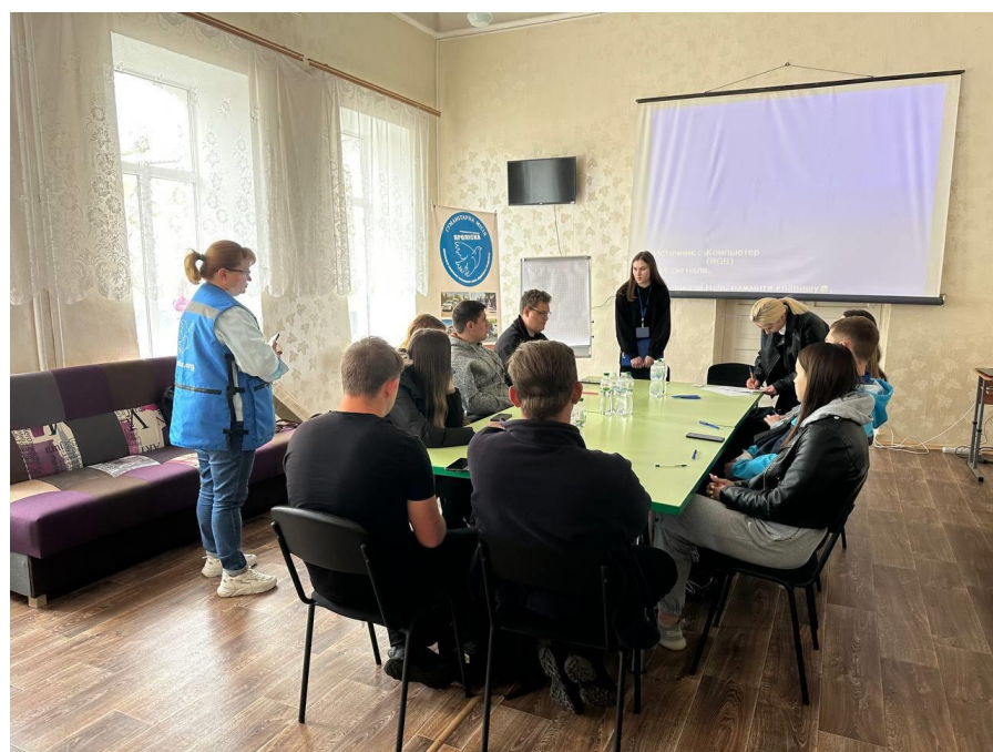
Рисунок Д.2 – Знайомство та вступ