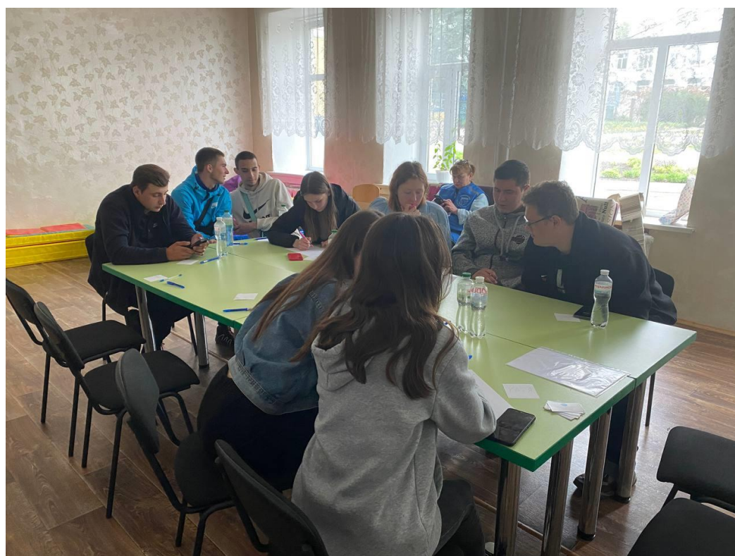
Рисунок Д.4 – Учасники під час виконання вправи