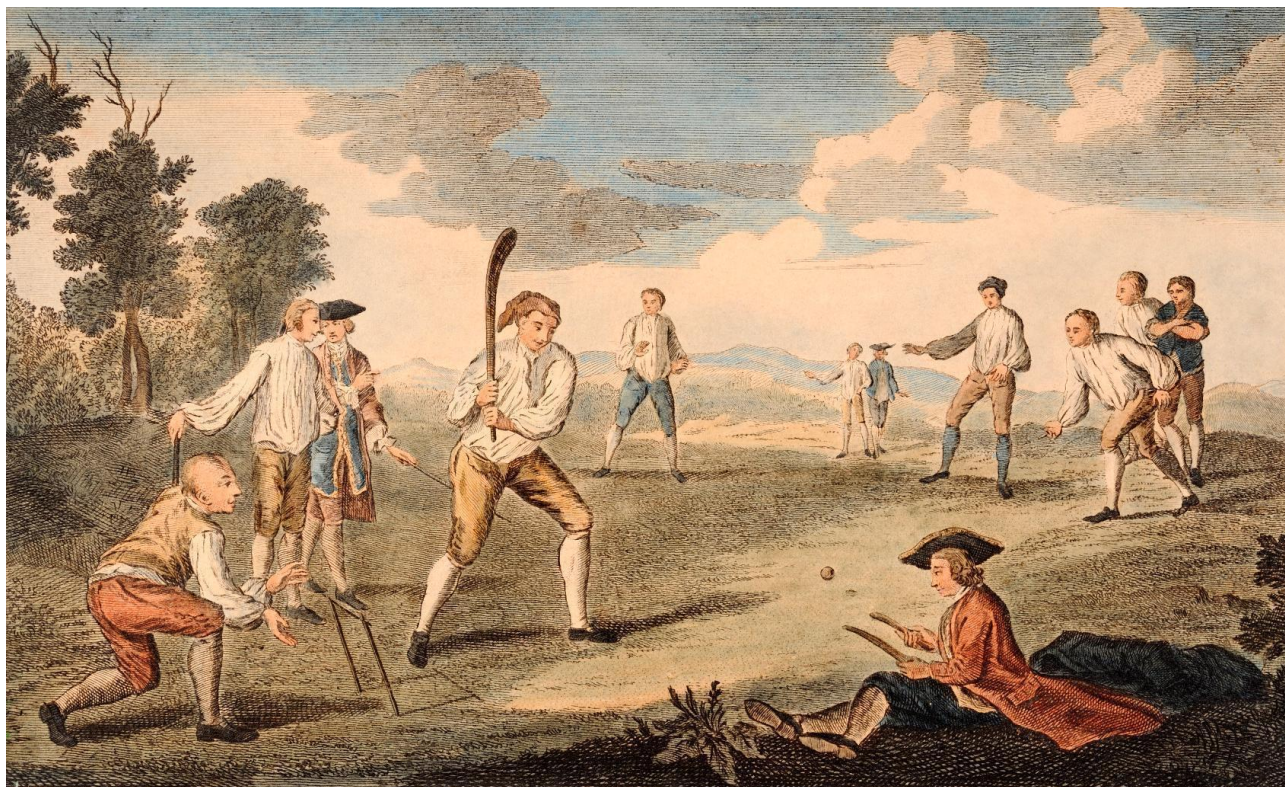
Дод. 1: Cricket On The Artillery Ground [ICC]