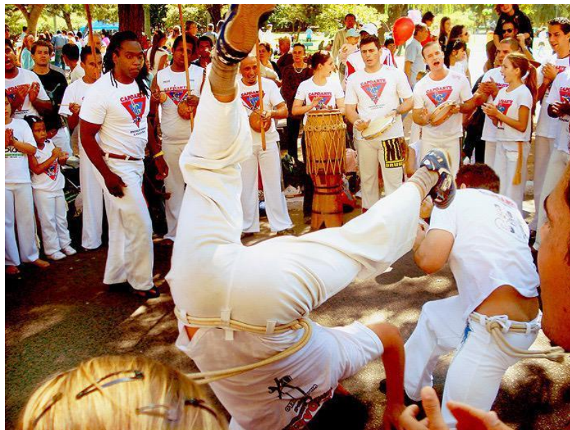
Дод. 4: Roda de capoeira