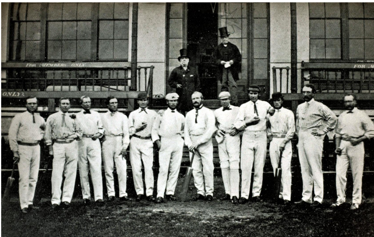
Дод. 2: The first instances of cricket [ICC]