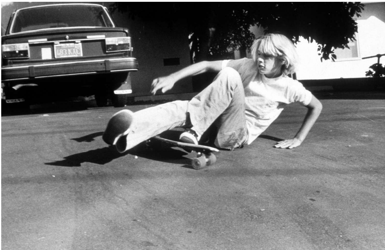
Дод. 5: Z-boys.