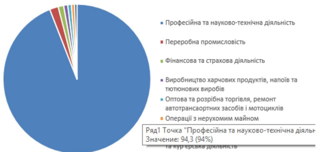
Рис. 2.2. Прямі інвестиції (акціонерний капітал) з України за видами економічної діяльності у 2021 році, у % до загального підсумку, (окрім тимчасово окупованих територій Донецької та Луганської області та АРК)