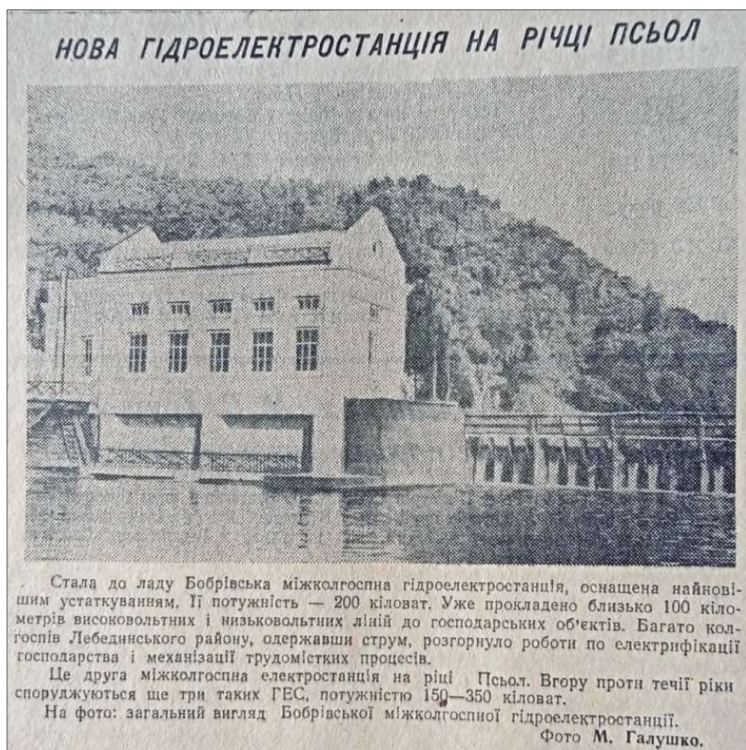
Фото 6. Фрагмент газети «Ленінська правда» від 23 вересня 1955 р. зі світлиною Бобрівської міжколгоспної ГЕС [4, с. 2]

супроводжувалися ще й зображеннями новозбудованих об'єктів. Наприклад, свого часу публікувалася світлина ще однієї міжколгоспної гідроелектростанції каскаду річки Псел – Бобрівської. Вона була розміщена в Лебединському районі Сумської області й стала до ладу в 1955 р. (Див Фото 6)