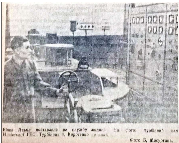
Фото 5. Фрагмент газети «Ленінська правда» від 17 січня 1953 р. зі світлиною турбінного залу Низівської міжколгоспної ГЕС [9, с. 2]

До того ж після пуску ця ГЕС вважалася чи не найуспішнішою та передовою в усій області. Тому офіційною пропагандою на місцевому рівні станція постійно подавалася як зразок організації «ударної» праці, на який мали рівнятися усі підприємства як енергетичної, так й інших галузей.