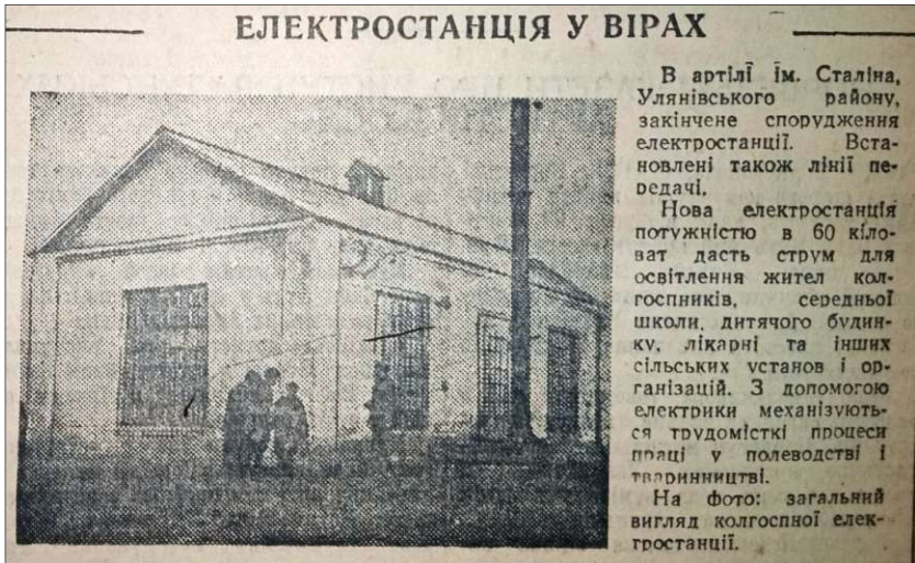
Фото 8. Фрагмент газети «Ленінська правда» від 4 листопада 1953 р. зі світлиною Вирівської колгоспної електростанції [2, с. 3]

Водночас жителі Вирів (Улянівський р-н) спорудили будівлю своєї колгоспної електростанції мурованою з цегли. (Див Фото 8)