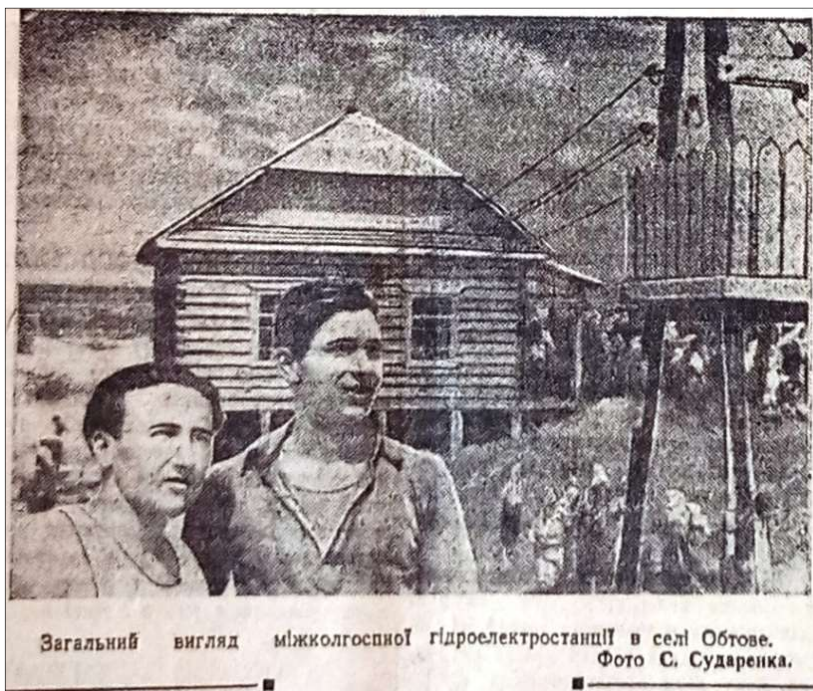
Фото 7. Фрагмент газети «Більшовицька зброя» від 7 червня 1949 р. зі світлиною Обтівської міжколгоспної електростанції [6, с. 3]

За світлинами, опублікованими на сторінках обласної газети, ми можемо робити певні висновки про характер і зовнішній вигляд деяких сільських електростанцій. Наприклад, очевидним є факт, що міжколгоспна електростанція в с. Обтовому (Кролевецький р-н) була збудована з дерева і на палях. (Див Фото 7)