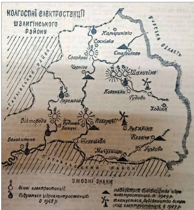
Фото 1. Карта електрифікації Шалигінського р-ну в газеті «Більшовицька зброя» за 10 квітня 1948 р. [5, с. 3]

Так, у квітні 1948 р. на газетній сторінці, повністю присвяченій електрифікації Шалигінського району, містилася ще й мапа місцевості із позначками розміщення різних енергетичних об'єктів [14, с. 3]. У липні 1953 р. подавалася аналогічна мапа, але вже всієї Сумської області [9, с. 3]. (Див. Фото 1-2)