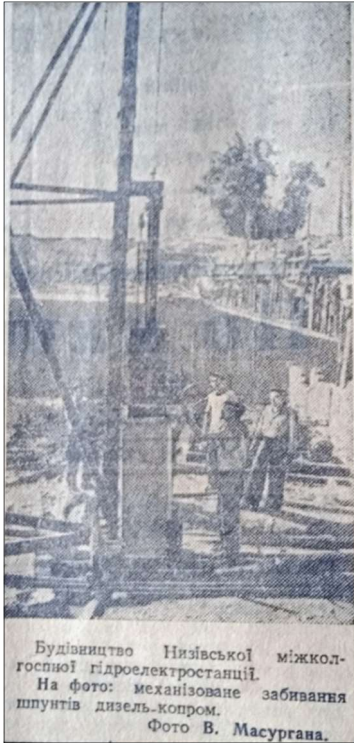
Фото 4. Фрагмент газети «Більшовицька зброя» від 27 липня 1951 р. зі світлиною будівництва Низівської міжколгоспної ГЕС [8, с. 2]

А невдовзі читачі «Більшовицької зброї» змогли побачити фотозображення, що демонструвало механізовані роботи із забивання шпунтів для захисту греблі. Ці роботи велися за допомогою дизель-копрової установки. (Див. Фото 4)