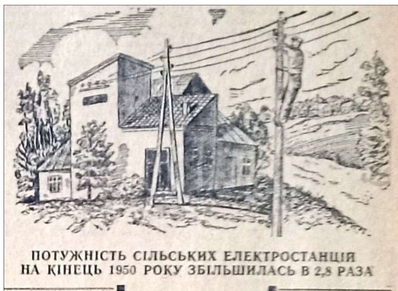
Фото 9. Фрагмент газети «Більшовицька зброя» від 27 травня 1951 р. з графічним зображенням типової будівлі сільської малої ТЕС [1, с. 3]

Крім фотографій увагу привертає і поодинокі графічне зображення енергетичного об'єкту в агітаційних матеріалах «Більшовицької зброї». Цей рисунок, зроблений вручну, супроводжує бравурний звіт про успіхи сільського господарства і не містить вказівки, де розміщена зображена споруда. ( Див Фото 9 )