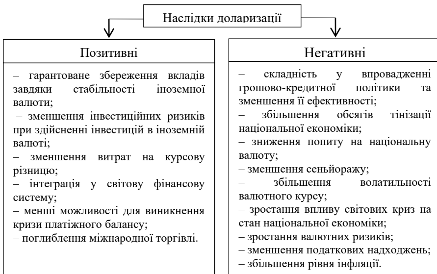
Рисунок 3 – Наслідки доларизації економіки України

Більшість з цих факторів взаємопов'язані й виникають за умов нестабільної економічної ситуації в країні, провокуючи ще більше погіршення стану економіки під впливом високого рівня доларизації. Провівши дослідження впливу доларизації на економіку України, варто зазначити, що загалом більшість науковців виділяють лише негативні наслідки високого рівня доларизації економіки, хоча деякі з них вважають, що існує й низка позитивних (рис. 3). Позитивні наслідки доларизації пов'язані зі зменшенням ризиків суб'єктів, що здійснюють розрахунки іноземною валютою. Однак, для економіки в цілому доларизація має лише негативний вплив.