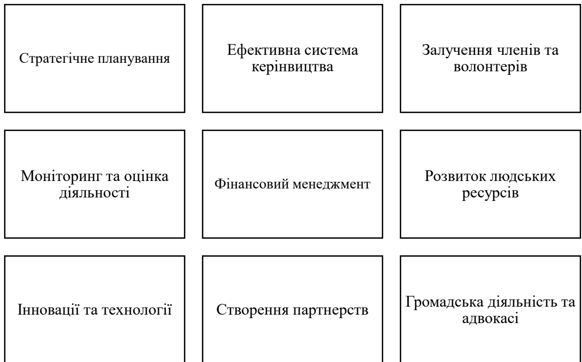
Рисунок 3.2 - Методи удосконалення механізму управління в громадських організаціях