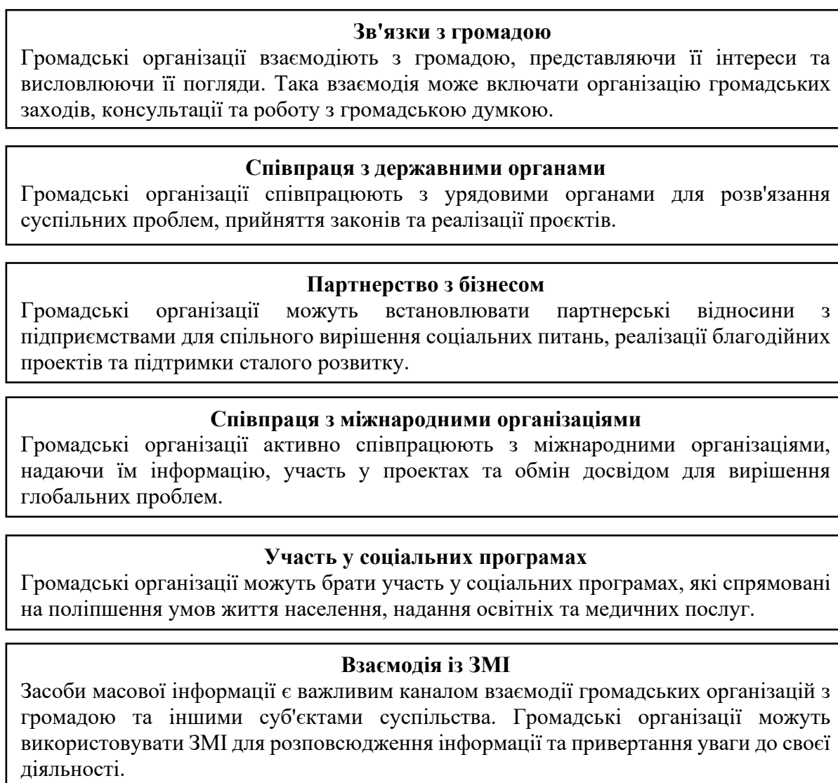
Рисунок 2.2 - Взаємодія громадських організацій з іншими суб'єктами суспільства

Взаємодія громадських організацій з іншими суб'єктами суспільства є ключовим аспектом їхньої ролі в громадянському суспільстві. Взаємодія відбувається на різних рівнях та включає в себе співпрацю з різними групами та інституціями. На рис. 2.2 візуалізовано взаємодію громадських організацій з учасниками демократичного суспільства.