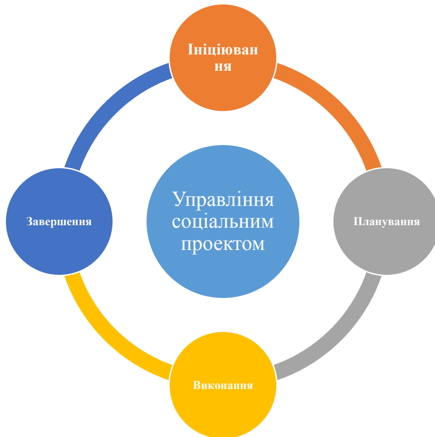
Рисунок 2.1 - Етапи успішної реалізації соціального проекту