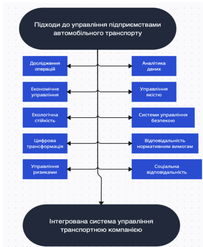
Рис.2. Підходи та методи в управлінні підприємствами автомобільного транспорту

Управління транспортною системою вимагає застосування різних науково-методичних підходів та методів для забезпечення ефективного функціонування і досягнення стратегічних цілей. Науково-методичні підходи можуть допомогти в розробці оптимальних маршрутів та розкладів громадського транспорту на основі аналізу пасажиропотоків, динаміки транспортних потреб та інших факторів, дозволяють ефективно використовувати такі ресурси, як паливо, транспортні засоби та персонал, можуть сприяти впровадженню стратегій сталого розвитку у галузі громадського транспорту тощо. В контексті цього варто звернути увагу на такі науково-методичні підходи та методи, які постійно розвиваються з прогресом технологій, змінами в транспортній галузі та змінами у вимогах клієнтів (рис. 2).