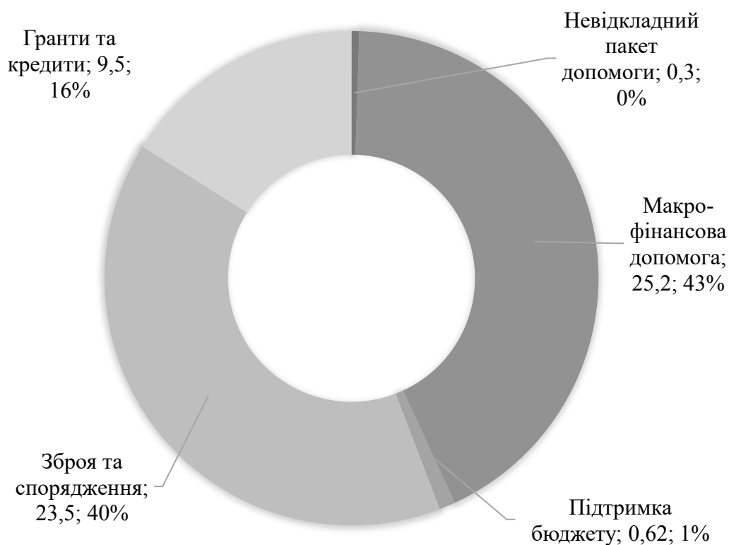
Рисунок 2. - Допомога Україні в період з 24 січня 2022 року по листопад 2023 року в млрд. євро [40].

Агресія Росії змусила ЄС змінити історичну політику та отримати більшу стратегічну автономію, щоб посилити свою здатність протистояти загрозам. Цей досвід зміцнив позиції України в системі безпеки Європи. Продовження економічної та військової підтримки ЄС матиме важливе значення для шляху України до членства та тривалого післявоєнного відновлення. Нижче наведена структура допомоги від Європейського Союзу (Рис. 2).