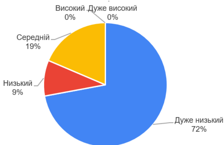
Рисунок 2 – Результати тесту для діагностики Інтернет-залежності.

По другій методиці, більшість учасників (72%) не виявляють високого рівня інтернет-залежності та ведуть спокійний спосіб життя, навіть коли вони не підключені до інтернету. Результати показали, що переважна кількість учасників (72%) мають дуже низький рівень залежності, 8% – низький рівень, і лише 21% – середній рівень залежності (Рис. 2).