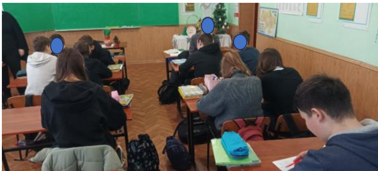
Фото 2. Проведення симуляційної гри(робота в командах)