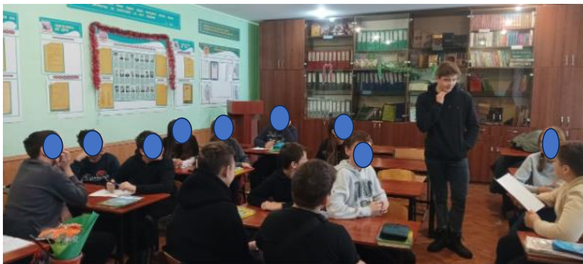
Фото 1. Проведення симуляційної гри(ознайомлення з правилами)