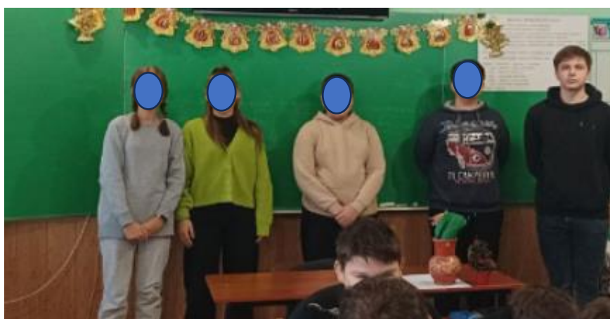
Фото 3. Найактивніші учасники