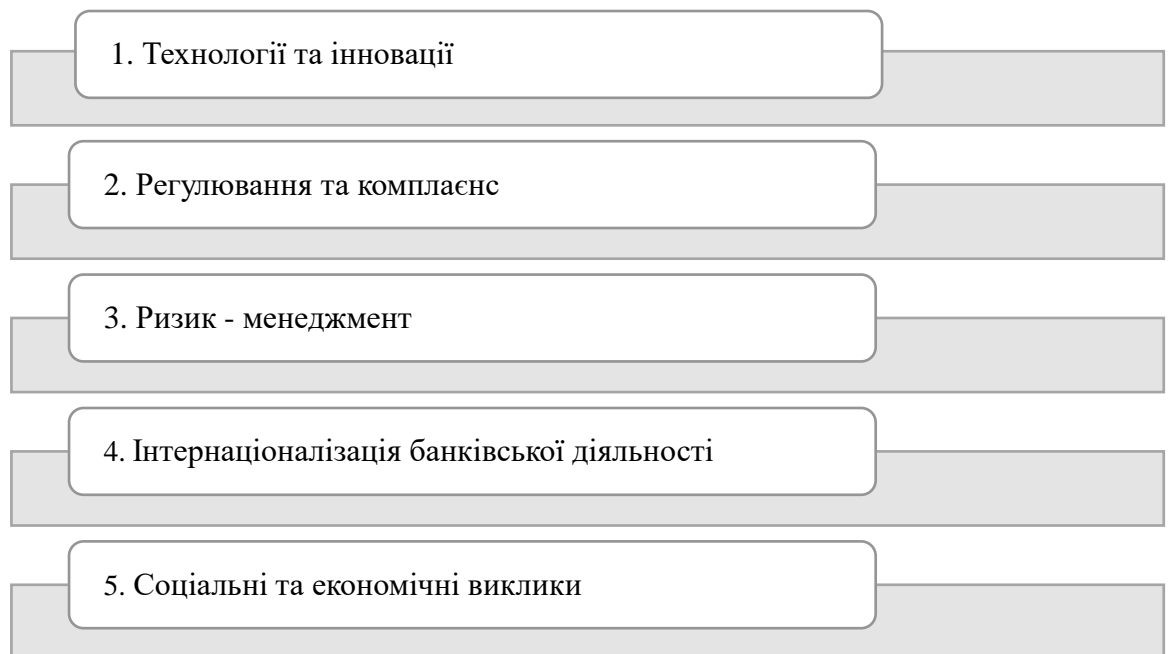
Рисунок 2.1. – Основні напрями впливу глобалізації в Україні на банківський сектор

Розглянемо напрями впливу глобалізації в Україні на рисунку 2.1: