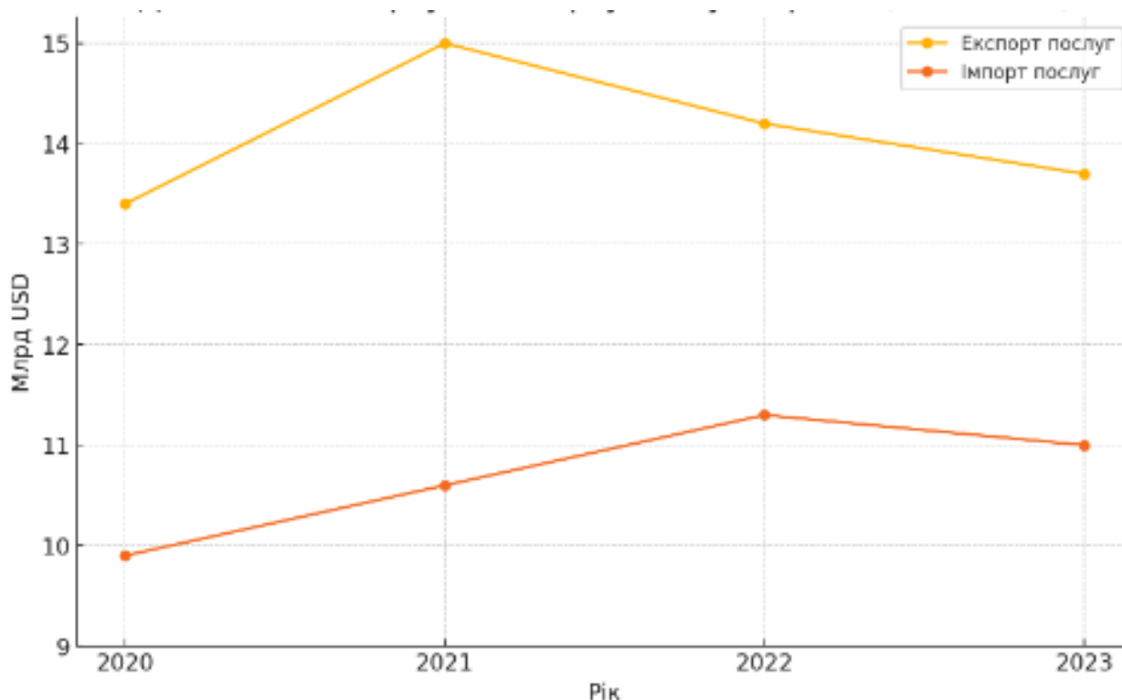
Рисунок 2.3 –Динаміка експорту та імпорту послуг України

Порівняння з країнами-сусідами та провідними країнами світу показує, що Україна має ще багато чого досягти, щоб наблизитися до рівня розвинених економік. Для цього необхідно продовжувати вдосконалення економічної політики, зміцнення інститутів та покращення інвестиційного клімату. Це дозволить Україні не тільки покращити свої позиції в міжнародних рейтингах, але й забезпечити стабільний економічний розвиток у довгостроковій перспективі.[23]