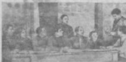
В с. Давидівці (Чернівецька область) працює комсомольська група, яка допомагає селянам налагодити роботу на новому році радянського краю.