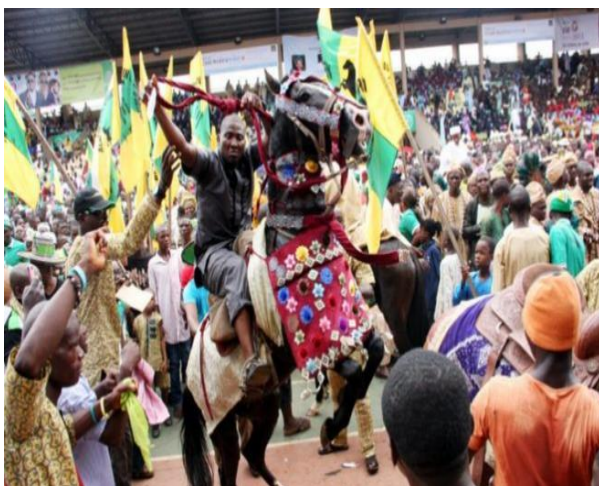
Pic. 2. The Ojude Oba Festival