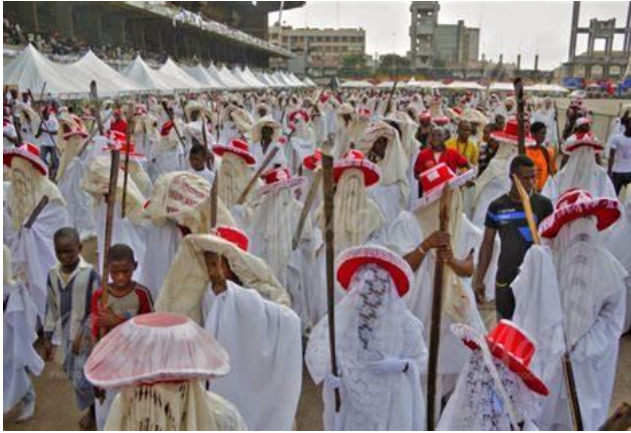
Pic. 3. The Eyo Festival