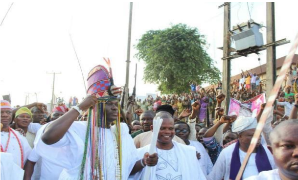
Pic. 4. The Olojo Festival

The Sango Festival is an annual festival in Nigeria held among the Yoruba people in honour of Sango, a thunder and fire deity who was a warrior and the third king