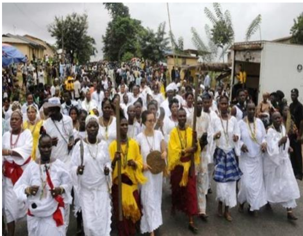
Pic. 1. Osun-Osogbo Festival

in three days by the lighting of the 500-year-old sixteen-point lamp called “Ina Olojumerindinlogun” (see pic. 1).