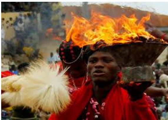
Pic. 5. The Sango Festival

. The festival is usually held in August at the palace of the Alaafin of Oyo Land.