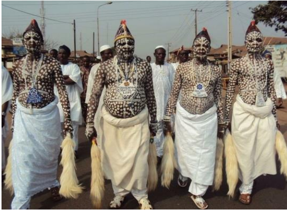
Pic. 6. The Oro Festival

The Oro Festival is a festival celebrated in almost all Yoruba settlements and towns in Nigeria. The festival is an annual one with only male descendants of the paternal natives of the town where the festival is taking place. During the Oro festival, non-natives and females stay indoors because it is believed that it is a taboo for a woman or anyone who is not allowed to participate in the festival to see the Oro (see pic. 6).