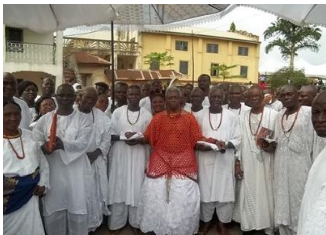
Pic. 7. The Igogo Festival

festival takes place every year in the month of September and lasts for seventeen days. During the festival celebration, the king of Owo and the high chiefs all dress like women wearing beaded gowns, coral beads, head gears and caps with their hair plaited (see pic.7).