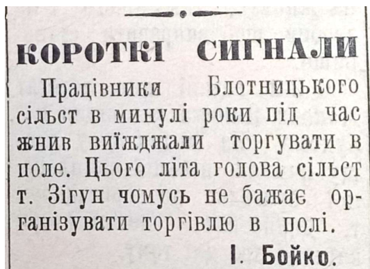
Фото 1. Повідомлення в газеті «Колгоспник Талалаївщини» за 23 липня 1960 р.