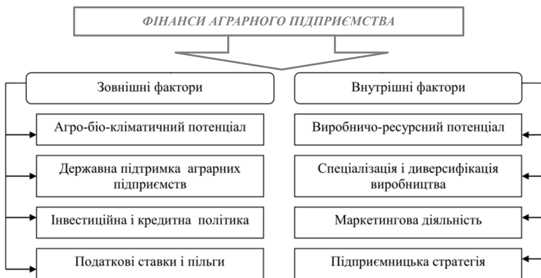
Рисунок 1.2 – Склад факторів, що впливають на формування фінансів аграрного підприємства

Таким чином, на формування фінансів аграрного підприємства, з урахуванням галузевих особливостей його функціонування впливають дві протилежні групи факторів – не залежні від функціонування підприємства (зовнішні) та внутрішні фактори, що можуть піддаватися моніторингу з боку підприємства та є впливовими з позиції управління (рис. 1.2).