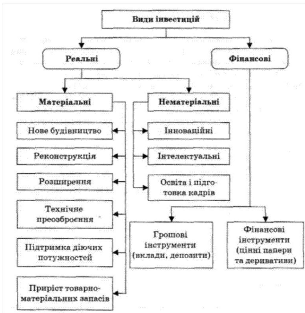
Рис 1.2 Види інвестицій