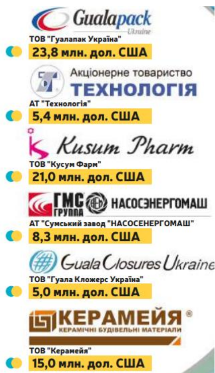
Рисунок 2.2 – Муніципальні інвестиційні проекти

Можна говорити про такі успішні впроваджені інвестиційні історії Сумського регіону (рисунок 2.2)