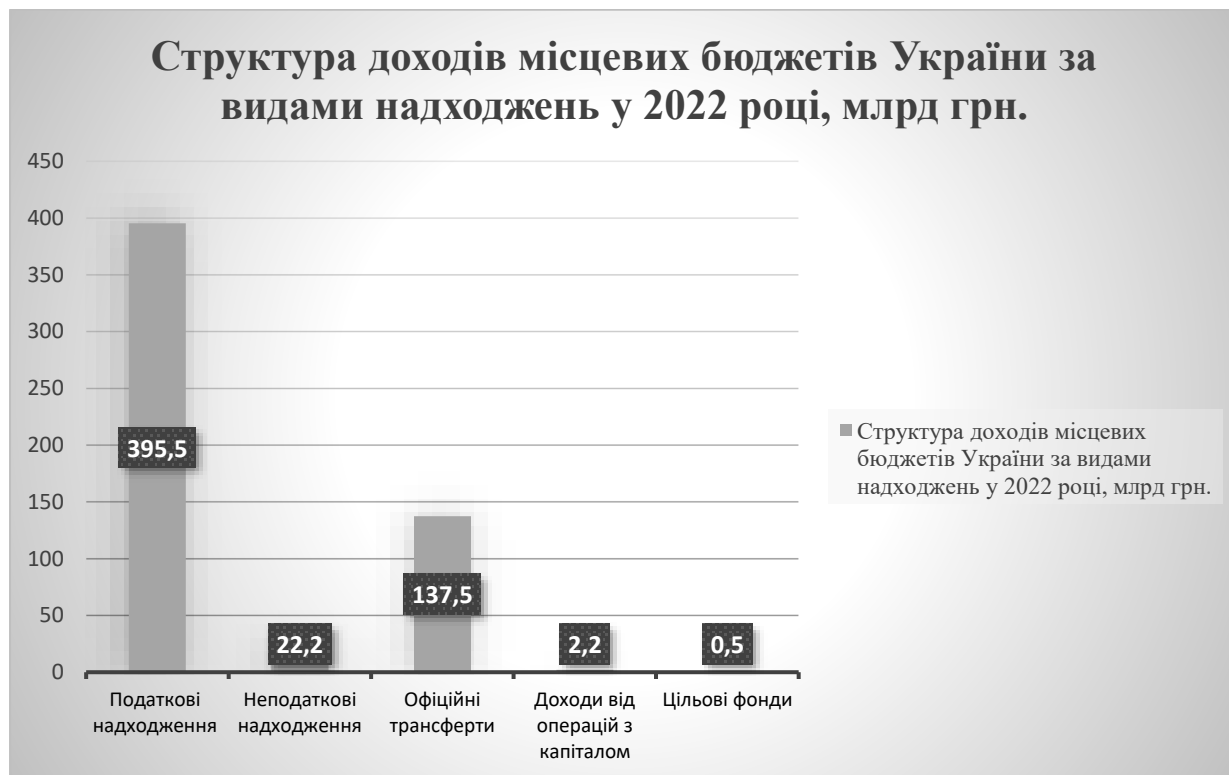
Рис. 2.5 Структура доходів місцевих бюджетів України за видами надходжень у 2022 році, млрд грн.

У структурі доходів місцевих бюджетів у 2022 році за видами надходжень (рис. 2.3) найбільшу частку (70,9%) склали податкові надходження – 393,5 млрд грн, а четверту частину (24,7%) становили офіційні трансферти.