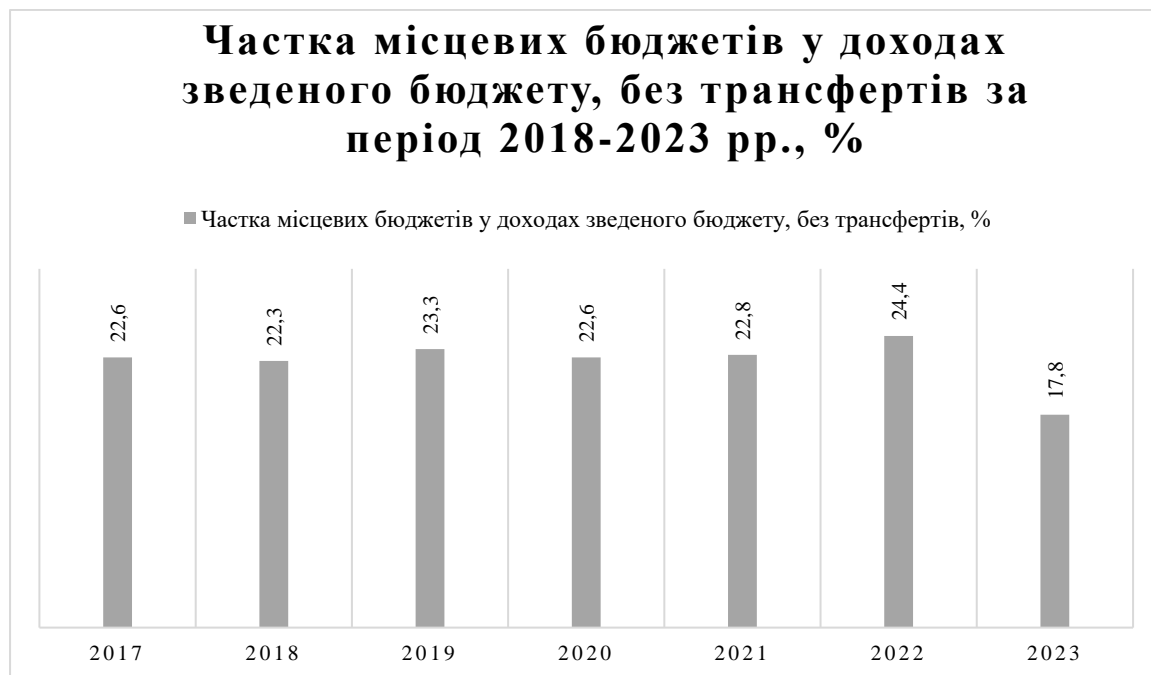
Рис. 2.4 Частка місцевих бюджетів у доходах зведеного бюджету, без трансфертів за період 2018-2023 рр., %

знизилася з 24,4% у 2022 році до 17,8% у 2023 році, що є нижчим за рівень 2015 року і відповідає показнику 2011 року (рис. 2.2).