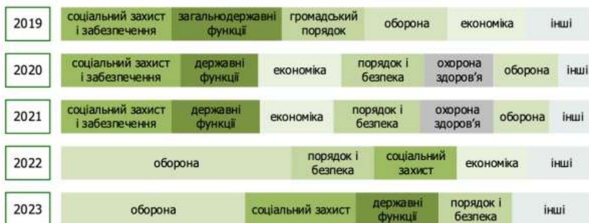
Рис. 2.6 Пріоритетність державних видатків в Україні у 2019-2023 рр.

за залишковим принципом. До цього переліку також частково відноситься сфера охорони здоров'я, за винятком періоду 2020-2021 років, коли відбувалися інтенсивні заходи у зв'язку з пандемією COVID. До початку повномасштабного конфлікту головними пріоритетами для української влади були загальнодержавні функції та соціальний захист та забезпечення.