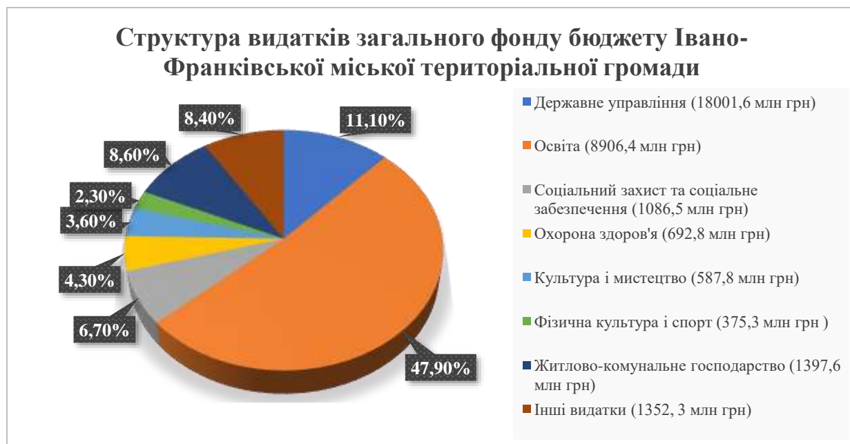
Рис. 2.2. Структура видатків загального фонду бюджету Івано-Франківської міської територіальної громади

на інші захищені статті – 213,3 млн гривень (15,5%).