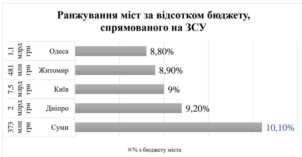
Рис. 2.1. Ранжування міст за відсотком бюджету, спрямованого на ЗСУ

Якщо брати на увагу підтримку Сил оборони місцевими бюджетами у 2023 році, можемо зробити висновок, що Суми входять до ТОП-5 обласних центрів з найбільшою підтримкою.