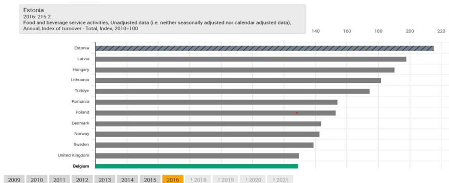
Рис. 2. Приріст обороту послуг в галузі діяльності із забезпечення стравами та напоями серед обраних країн ЄС, річні дані, 2016 рік (в індексних цінах, порівняно з 2010 р.) [1].

Найбільший приріст обороту від діяльності із забезпечення стравами та напоями серед країн Європи у 2016 році порівняно з оборотом 2010 року спостерігався в країнах Балтії, Угорщині, Турції, і складав понад 40% від обороту 2010 року (рис.2). Найбільше зростання галузі відбулось в Естонії і склало в 2016 році понад 100% (індекс 215.2).