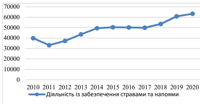
Рис. 4. Тенденції зміни кількості закладів зі забезпечення стравами та напоями в Україні за 2010-2020 роки [6]

Дані Укрстату свідчать, що за останні роки діяльність із забезпечення стравами та напоями в Україні також постійно зростала (рис.4).