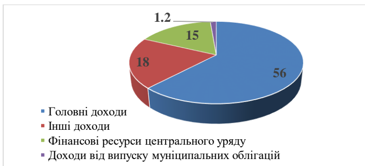
Рисунок 1 – Структура доходів місцевих бюджетів у Японії [6]

повноваження. У 2023 р. обсяг головних доходів японських місцевих бюджетів (включно з префектурою) становив 56,1% (рис. 1) [6].