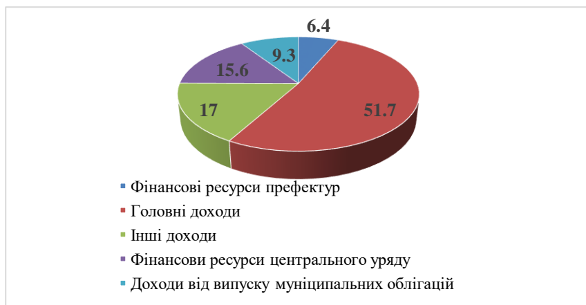
Рисунок 2 – Структура доходів місцевих бюджетів муніципалітетів Японії в 2023 р.

Для більшої конкретизації проведеного аналізу необхідно також розглянути структуру доходів бюджету у власне японських муніципалітетів. У цілому нині структура аналогічна раніше розглянутій структурі доходів щодо загальної сукупності муніципальних утворень Японії (з урахуванням префектур): розподіл часток за доходними джерелами однаково, відмінності перебувають лише у рівні їх значень. Однак при цьому в структурі доходів муніципалітетів з'являється окрема стаття доходів – фінансові ресурси префектур (prefecturaldisbursements), що спрямовуються до бюджетів муніципалітетів (рис. 2).