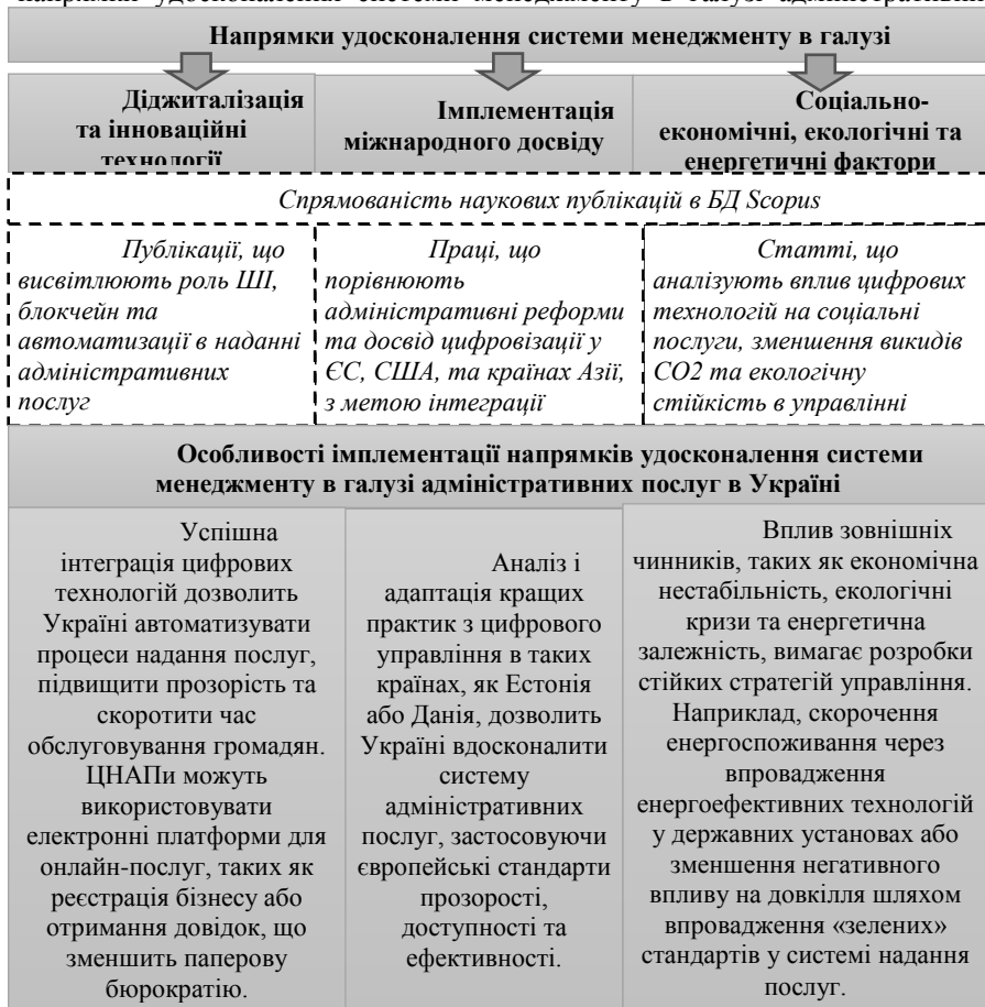
Рисунок 4 – Напрямки удосконалення системи менеджменту в галузі адміністративних послуг