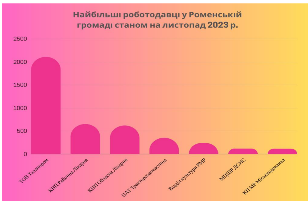
Рисунок 1.1. – Найбільші роботодавці громади