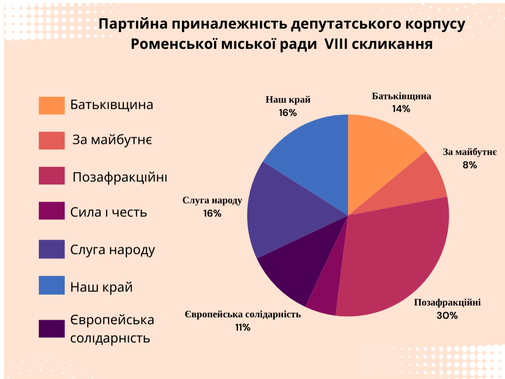
Рисунок 1.2. – Партійна приналежність депутатського корпусу Роменської міської ради VIII скликання