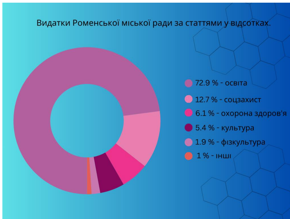
Рисунок 2.4. – Видатки громади за статтями у відсотках.

На сьогодні у Роменській міській територіальній громаді діє 33 цільові програми.