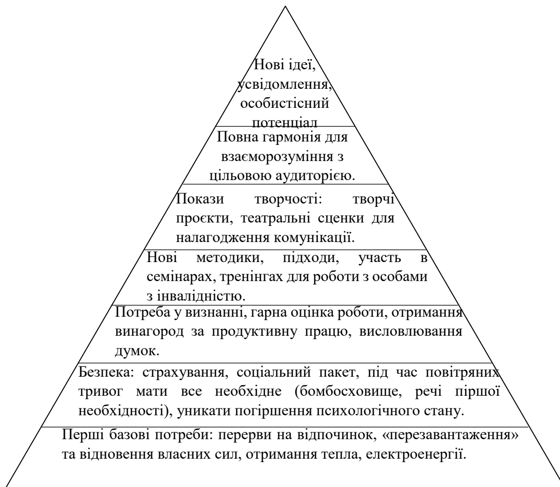
Рисунок 3.1. Потреби працівників територіального центру, які працюють з особами з інвалідністю

Піраміда потреб Маслоу є корисним інструментом для аналізу потреб працівників, які працюють з людьми з обмеженими можливостями в територіальному центрі. Ось як ми описали цю групу на сім рівнях на основі бази дослідження за працівниками (рис.3.1.):