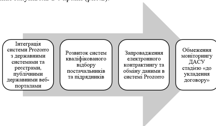
Рис. 2 – Інструменти вдосконалення публічних закупівель в Україні (авторська розробка)

З урахуванням викладеного слід зазначити, що крім впроваджених державою механізмів, що сприяли підвищенню ефективності закупівель, запропоновано до запровадження власний блок інструментів вдосконалення публічних закупівель в Україні (рис.2).