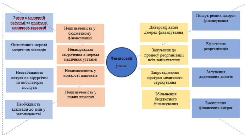
Рисунок 2. – Побудова діаграми -метелик для КП ОКЛВЛДПОР за фінансовими ризиками)