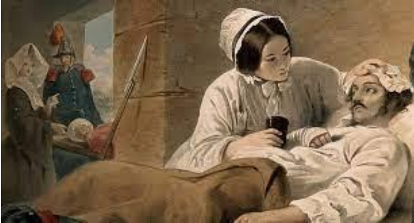
Флоренс Найтінгейл – відома сестра милосердя

12 травня – у день народження видатної англійки Флоренс Найтінгейл, яка організувала перші у світі бригади сестер милосердя, відзначають Всесвітній день медичної сестри