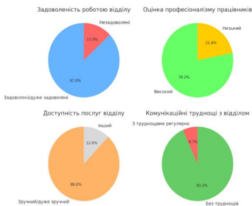
Рисунок 2 - Аналіз якості обслуговування відділу адміністрування податків і зборів з фізичних осіб та єдиного внеску, розгляду звернень платників податків (побудовано автором на основі проведених опитувань)

Для оцінки якості оцінювання послуг, що надаються податковими органами автором біло проведено опитування клієнтів Сумського відділу ДПС. В опитуванні взяли участь 105 респондентів. Серед них найбільша частка належить до вікової групи 36-45 років (23,8%), з яких близько 70% складають жінки. Досить значну частину складають підприємці (36,2%), а також пенсіонери. Результати опитування дозволяють глибше зрозуміти потреби платників податків і їх оцінки роботи податкового відділу, що допомагає підвищити ефективність обслуговування та адаптувати адміністративні процеси до реальних потреб громадян та бізнесу. Аналіз якості обслуговування Сумським відділенням ДПС наведений на рисунку 2.