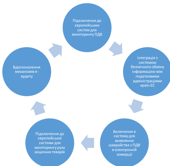
Рисунок 3 - Кроки до підвищення ефективності податкової системи в Україні