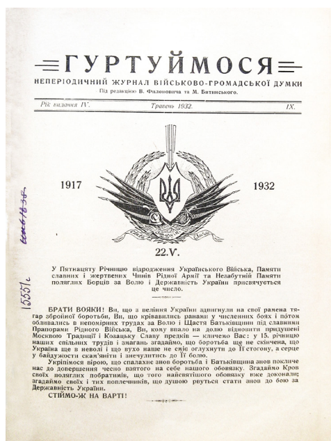
Іл. 4. Перша сторінка журналу «Гуртуймося», видавцем і співредактором якого був В. Філонович.

проти червоної армії змушений був відступити до Гадяча, де в січні 1919 р. сформував й очолив Сумський окремих курінь 4-го полку Січових стрільців. На чолі підрозділу пройшов бойовий шлях від Гадяча до Житомира. Тричі був важко поранений в груди й обидві руки та контужений. Восени, за наказом С. Петлюри, його призначили старшиною з особливих доручень при Головному Отамані Військ УНР, хоча формально числився при штабі Окремого корпусу прикордонної охорони. У цей час він займався закупівлею зброї для Армії УНР 9 .