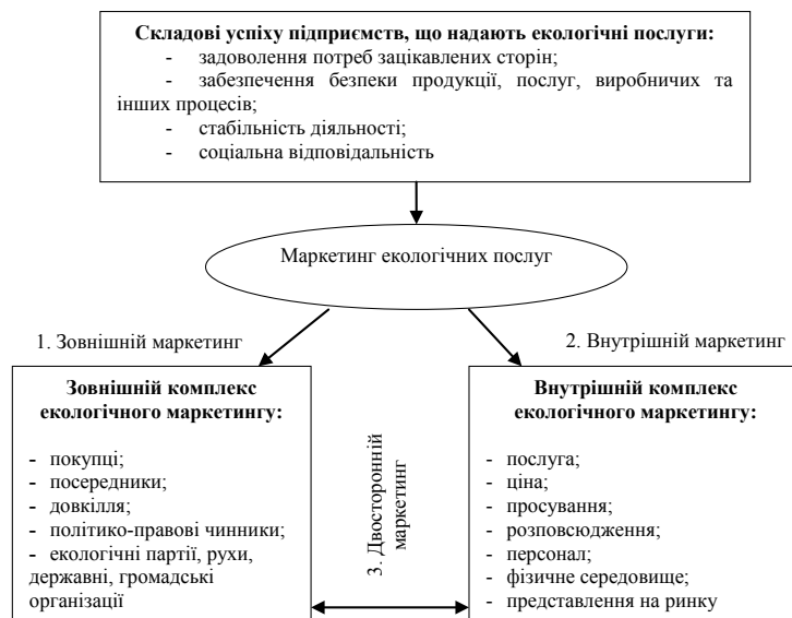
Рисунок 2 – Три види маркетингу у сфері екологічних послуг

Разом з тим маркетингова діяльність у сфері екологічних послуг потребує більше ніж чотири традиційних складових комплексу екологічного маркетингу. Ф. Котлер виділяє у сфері послуг поняття внутрішнього, зовнішнього та двостороннього маркетингу. У сфері екологічних послуг ці види маркетингу трансформуються таким чином (рис. 2).