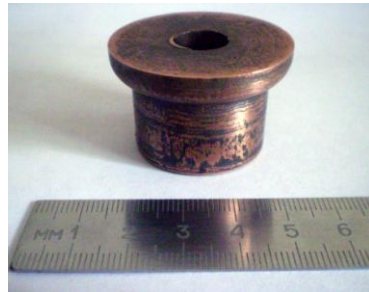
Рисунок 1 – Заготовка деталі «втулка з буртом» після штампування: а – креслення, б – фотографія

Контроль виробів після видавлювання тіла втулки при 600°C показав відсутність макродефектів. Отримані деталі характеризуються високою міцністю і антифрикційними властивостями, рівнощільністю, причому відмінність щільності вихідної і фланцевої частини деталі не перевищує 1%.