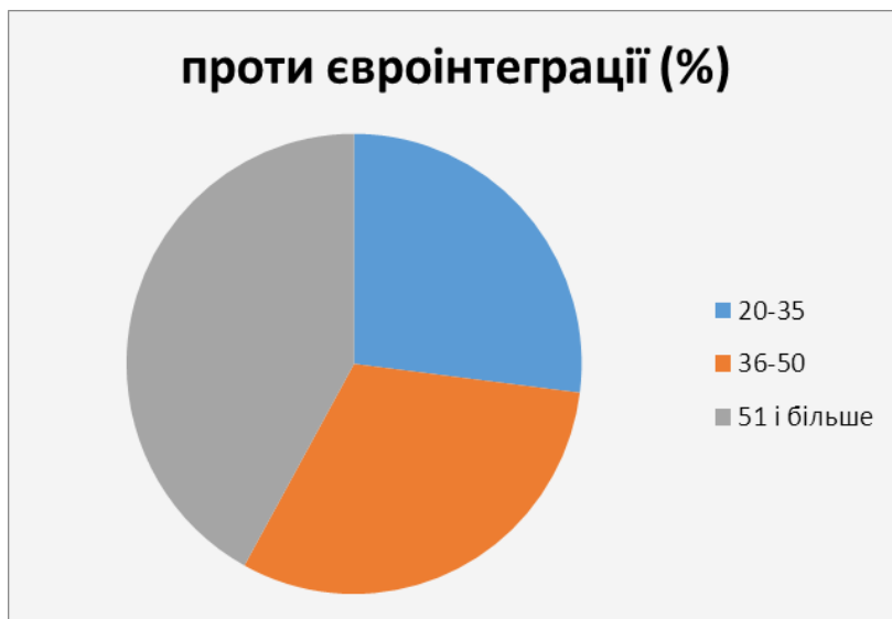
Рис.2. Голоси британців на референдумі проти Brexit