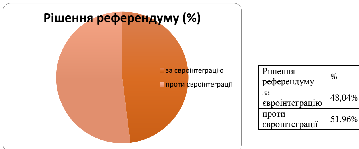
Рис.1. Статистики голосів на референдумі

Проаналізувавши результати референдуму у Великобританії можна зробити висновок, що прихильників Європейського Союзу, незалежно від вікової категорії населення, було менше, проте не суттєво.