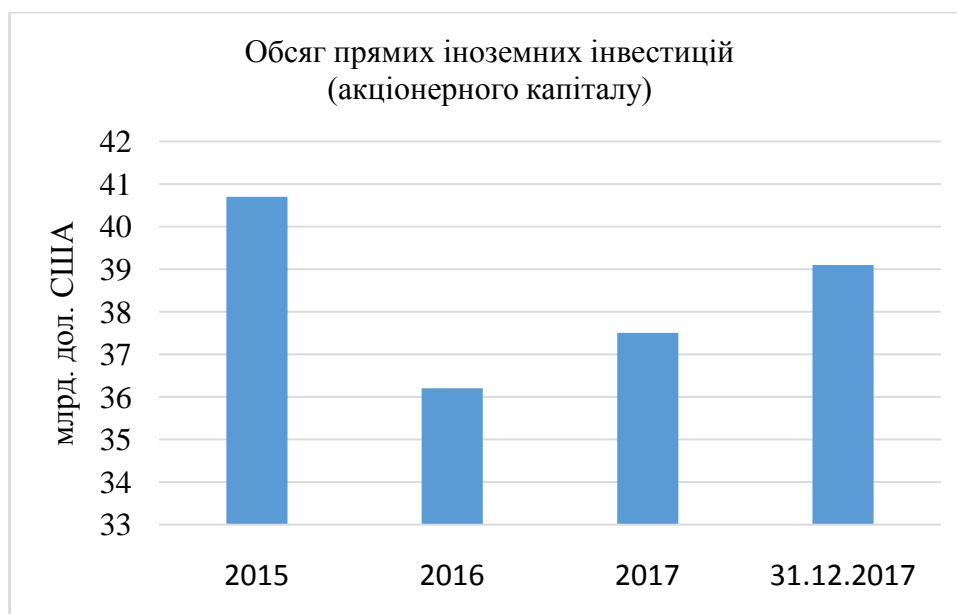
Рисунок 2. — Обсяг прямих іноземних інвестицій за 2015-2017 рр. в Україні (джерело: побудовано авторами на основі даних [6]).

Завдяки прямим іноземним інвестиціям відбувається позитивний вплив на економічний розвиток країни. А саме, відбувається ефективне використання ресурсів, що підвищує продуктивність факторів виробництва. Вони впливають на матеріальне виробництво, його розвиток, а також сферу надання послуг.