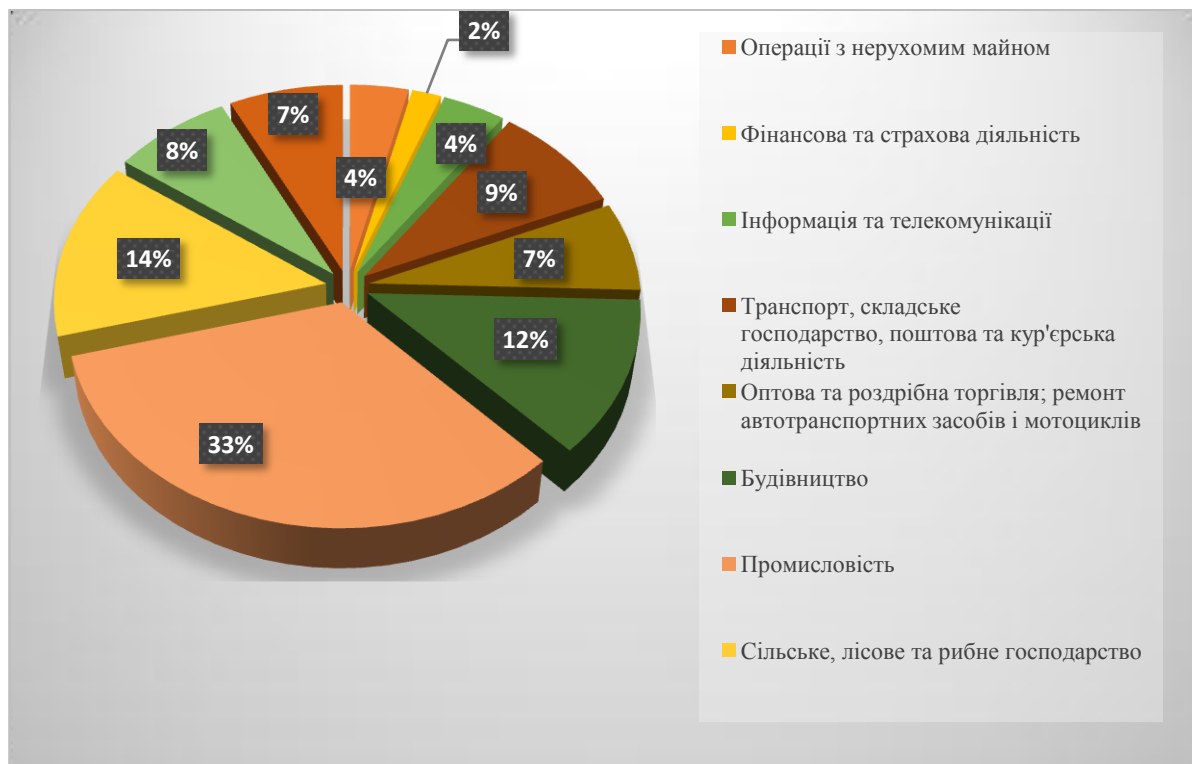
Рисунок 4. — Розподіл капітальних інвестицій за сферами економічної діяльності (у % до загального обсягу)

Інформація та телекомунікації та операції з нерухомим майном становлять 4%. Найменше значення має фінансова та страхова діяльність — всього 2%. Отже можемо зробити висновок, що іноземні інвестори вкладають свої кошти в більш розвинені сфери економічної діяльності.