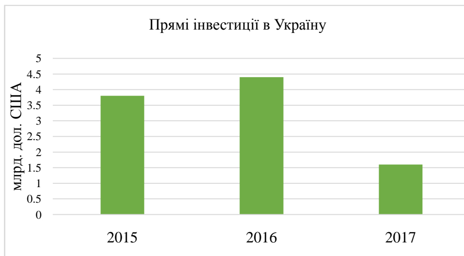
Рисунок 1. — Вкладення прямих інвестицій за 2015-2017 рр. в Україну (джерело: побудована авторами на основі даних [6])

досягає 2016 рік. Там вклад прямих іноземних інвестицій (акціонерного капіталу) складає 4,4 млрд. дол. США. Це проілюстровано на рисунку 1.