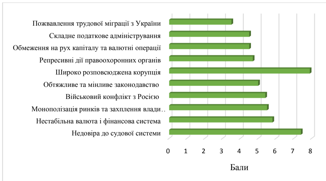
Рисунок 5. — Топ-10 перешкод для іноземних інвестицій в Україну

Аналізуючи дослідження Європейської Бізнес Асоціації, які показані на рисунку 5 багато бізнесменів бачать високий рівень корупції в Україні. Тобто, сприятливому інвестиційному клімату України перешкоджає хабарництво. Згідно з рисунком 5, корупція посідає перше місце серед проблем інвестиційного клімату.