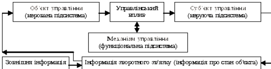
Рис. 1. Взаємозв'язок елементів системи управління конкурентоспроможністю банку, авторська розробка

Взаємозв'язки основних елементів системи представлено на рис. 1.