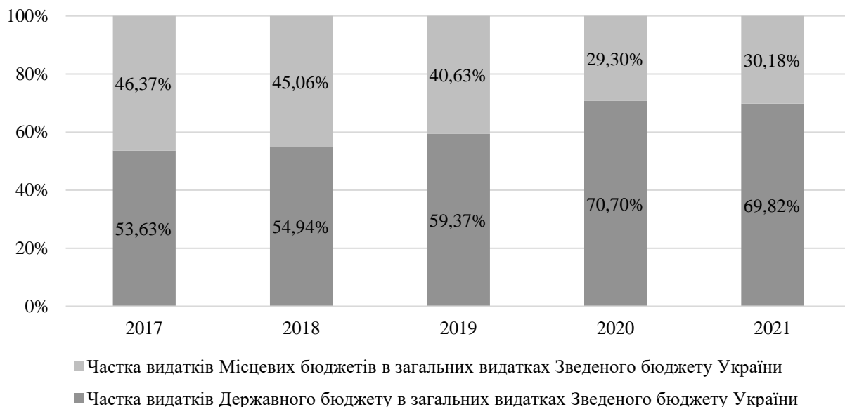
Рисунок 2.2 – Частка видатків Місцевих та Державного бюджетів в сукупних видатках Зведеного бюджету

Аналізуючи дані наведені на рисунку 2.2, можемо дійти висновку, що дедалі менше соціальних видатків перекладається з державного на місцеві бюджети. Так, загальний обсяг видатків місцевих бюджетів у Зведеному бюджеті України впродовж 2017-2021 років демонструє тенденцію до зменшення з 46,37 % в 2017 році до 30,18 % в 2021 році. Таке різке зменшення даного показника вказує на те, що держава поступово забирає в місцевої влади можливість розпоряджатися власними доходами, та все більше здійснює перерозподіл ресурсів через Державний бюджет. Дана тенденція є негативною, оскільки йде наперекір реформі децентралізації, та зменшує фінансову самостійність об'єктів місцевого самоврядування.