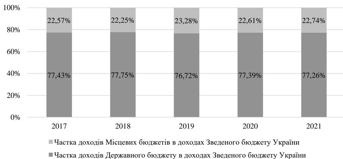
Рисунок 2.1 – Частка доходів Місцевих та Державного бюджету в доходах Зведеного бюджету за 2017-2021 роки (без врахування міжбюджетних трансфертів)

Аби краще проілюструвати питому вагу місцевих бюджетів у зведеному бюджеті потрібно поглянути на процентне співвідношення державного і місцевих бюджетів. Дані про це наведено на рисунку 2.1