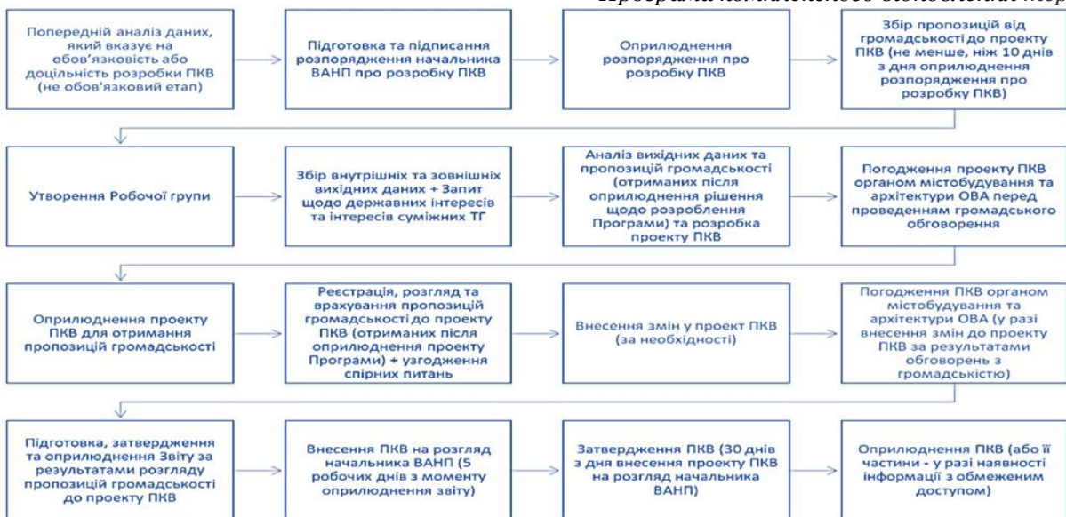
Рисунок 1: Алгоритм дій щодо розробки та затвердження Програми комплексного відновлення території

Алгоритм розроблення та затвердження Програми не передбачає заходів та практик, спрямованих на забезпечення гендерної рівності та соціальної справедливості, оскільки: