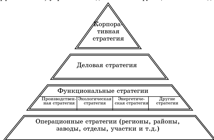
Рисунок 2 - Пирамида разработки стратегии [15, С.71 - адаптировано]

Итак, к первому уровню относятся эффект (эффективность) управления и деятельности предприятия в целом. Это общеорганизационный уровень, где разрабатывается корпоративная и деловая стратегии. Ко второму уровню мы отнесли показатели эффекта (эффективности) управления и деятельности функциональных подсистем.