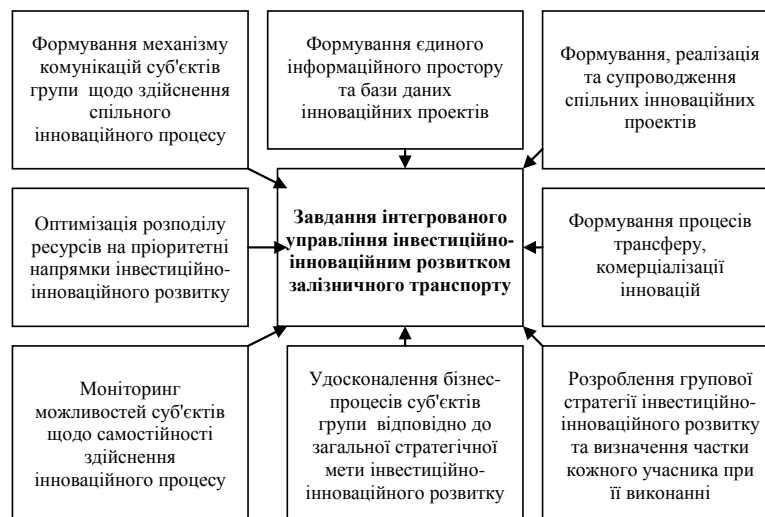
Рисунок 1 – Завдання інтегрованого управління інвестиційно-інноваційним розвитком залізничного транспорту

транспорту (ІУІРЗТ), що є управлінням на основі об'єднання економічних ресурсів, процесів та знань, спрямованим на виявлення та максимально повне використання можливостей та спроможностей суб'єктів групи щодо забезпечення інвестиційно-інноваційного розвитку залізничного транспорту при одночасному забезпеченні відповідності між їх потребами та ступенем їх задоволеності (рис. 1).