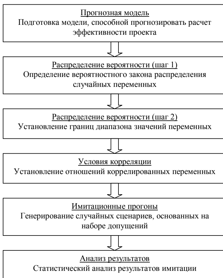
Рис. 2. Процесс анализа риска

Процесс анализа риска может быть разбит на следующие стадии (рис. 2).