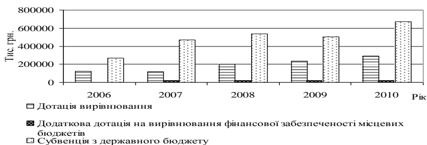
Рисунок 2 – Надходження трансфертів з державного бюджету до загального фонду бюджету Сумської області в 2006 – 2010 рр.

аналізованого періоду спостерігалось недовиконання плану за отриманням субвенцій. Отримані дотації складають 26,48% обсягу міжбюджетних трансфертів. На дотації вирівнювання припадає 77,95%. Обсяг трансфертів з державного бюджету до загального фонду бюджету Сумської області представлений на рис 2.