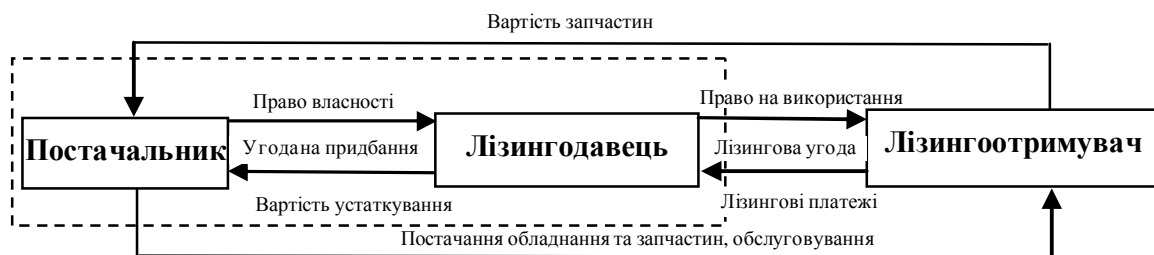
Рис. 2 Взаємовідносини учасників лізингової угоди

У класичній лізинговій угоді беруть участь три суб'єкти: лізингодавець (власник предмета лізингу), лізингоотримувач (суб'єкт, що отримує у користування предмет лізингу), постачальник (продавець, виробник об'єкта лізингу), взаємовідносини між якими схематично показано на рис. 2. Слід зазначити, що зазначена система взаємовідносин спрощується, якщо постачальник є також лізингодавцем, як це показано на рис. 2. пунктирною лінією.