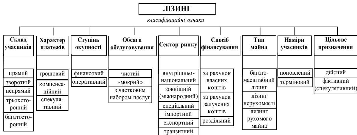
Рис. 4 Класифікація видів лізингу

Світова практика виробила численні варіанти лізингових угод, однак дотепер не здійснено їх чіткої структуризації та не створено систематизації видів лізингу. На рис. 4 авторами запропонована класифікація видів лізингу залежно від ознак, які приймаються до уваги.