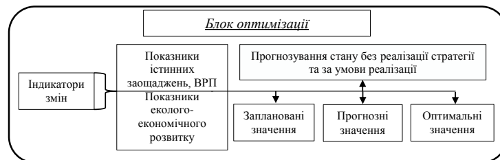
Рис. 2. Принципова схема концепції формування блоку оптимізації у стратегії еколого-економічного розвитку регіону

Оптимізацію показників можна представити блоком оптимізації, який необхідно розуміти як процес цілеспрямованої зміни значень всіх показників, що описують його запланований, фактичний та оптимальний стан, порівняння яких надає інформацію про досягнення стратегічних і тактичних границь або відхилення від наміченого руху (рисунок 2). Початковою позицією цього механізму буде формування системи індикаторів, цілісно і релевантно описуючих параметри мети, а також передбачувані зміни їх значень на проміжних етапах просування по стратегії. Потім необхідно визначити допустимі відхилення від основного тренду, як стратегічного потоку змін в рамках цілеспрямованого розвитку територіальної господарської системи. Структурно цей механізм представляє собою складну систему блоку, що забезпечує генерацію і цільову композицію стратегії; її реалізацію шляхом правильних методів, засобів та інструментів для розвитку регіону; стеження за траєкторіями і горизонтами розвитку; контроль дій і результатів; корегування регуляторів і цілей