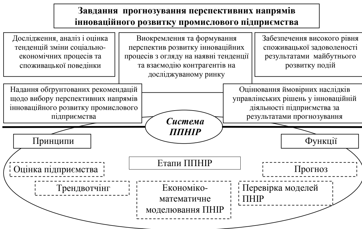
Рис. 1. Структурна схема системи прогнозування перспективних напрямів інноваційного розвитку на промисловому підприємстві

При формуванні організаційно-економічного механізму управління прогнозуванням напрямів інноваційного розвитку необхідно чітко визначення мети, задля якої підприємство повинно впроваджувати даний процес у свою діяльність. Мета прогнозування перспективних напрямів інноваційного розвитку є похідною від загальної мети підприємства стосовно здійснення інноваційної діяльності, стратегічної діяльності та виконання місії підприємства загалом. Так, метою прогнозування перспективних напрямів інноваційного розвитку промислового підприємства можна вважати побудову прогнозу розвитку напрямів інноваційної діяльності на основі пошуку оптимальних своєчасних науково обґрунтованих альтернативних варіантів в часі і просторі при врахуванні перспективних тенденцій сьогодення та факторів, що сприяють прискоренню їхнього поширення. Виходячи із нашої мети стає можливим формування основних завдань прогнозування перспективних напрямів інноваційного розвитку промислових підприємств, що представлені на рис. 1. Дані завдання обумовлюють особливості виконання методичного підходу прогнозування перспективних напрямів інноваційного розвитку, що формують цілісну систему його здійснення на промисловому підприємстві.