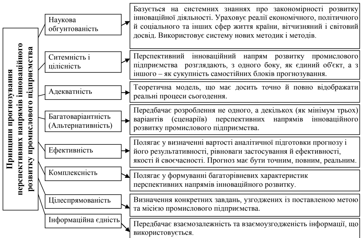
Рис. 2. Принципи прогнозування перспективних напрямів інноваційного розвитку промислового підприємства

Окрім принципів базисним компонентом теоретичного аналізу ППНІР виступають його функції. Будь-якому об'єкту дослідження гуманітарного спрямування властиві певні функції, які можна об'єднати у дві основні групи: теоретико-пізнавальні та практично-перетворювальні (управлінські). Відповідно і функції ППНІР промислового підприємства розподіляються на ці основні види. За аналізом наукових джерел [11, 12] нами здійснена конкретизація функцій прогнозування до функцій ППНІР, яке представлені в табл. 1.