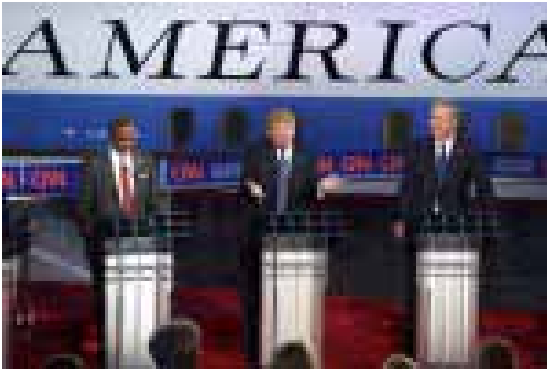
Три міфи про Україну

Кожна фотографія, як і будь-яка журналістська робота, має автора тобто, мусить бути підписана. Українські видання не завжди дотримуються цього правила. На сторінках газет з'являються фотографії, біля яких не вказано автора чи їхнє джерело.