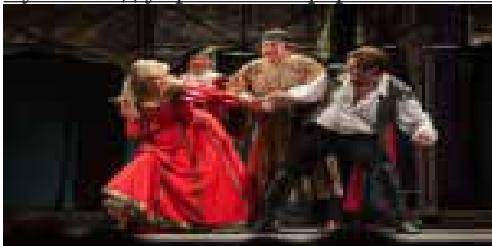
Приборкання норвливої» – 200-та вистава!