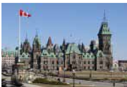
Фото об'єкта – це зображення одного чи групи предметів, коли головним завданням є показати сам предмет. Це можуть бути фото товарів, про які йдеться, цікавих речей, які читач раніше не бачив. Тобто це фотографії, де зображений сам предмет без прив'язки до місця і часу. Це є вид ілюстративних зображень, які самі по собі не можуть «розповідати» читачеві історію; зрозуміти, чому саме цей предмет тут зображений і чим він має бути цікавим, найчастіше можна зрозуміти лише з журналістського матеріалу. Цей жанр фотографії популярний у сучасних виданнях.