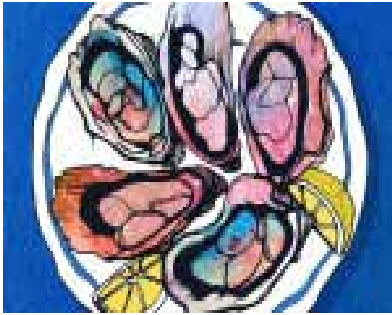
Ірландія запрошує на фестиваль устриць

Художнє фото. Зрозуміло, фотографії в пресі є документальними, водночас трапляються зображення, які не можна віднести до документалістики, в силу того, що вони не відображають якусь подію чи факт, які відбулися. На думку Патрісії Холланд, документальність у фотографії обов'язкова тоді, коли йдеться про актуальну подію інформацію. Водночас знімок, зміст якого не пов'язаний з конкретними подіями і який не претендує на актуальність, «нерідко потребує художньо-зображальних достоїнств, здатних не лише підкреслити, посилити зміст, але і стати органічним елементом самого змісту». [1, с. 516] Зазвичай, такі фотографії цікаві тим, що зняті під несподіваним кутом, коли обрано цікавий ракурс, цікавим може бути поєднання об'єктів на знімку. Головним у цьому випадку є не показ об'єкту, а його якісне й цікаве зображення.