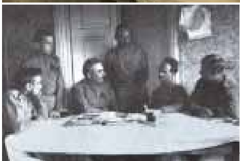
Біля витоків ОУН

Олексій Колосов пропонує виділяти три ознаки журналістських фотографій: документальність, достовірність, інформативність.