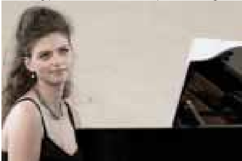
Базовий комплекс свого піанізму я успадкувала від української фортепіанної школи

Художнє фото. Зрозуміло, фотографії в пресі є документальними, водночас трапляються зображення, які не можна віднести до документалістики, в силу того, що вони не відображають якусь подію чи факт, які відбулися. На думку Патрісії Холланд, документальність у фотографії обов'язкова тоді, коли йдеться про актуальну подію інформацію. Водночас знімок, зміст якого не пов'язаний з конкретними подіями і який не претендує на актуальність, «нерідко потребує художньо-зображальних достоїнств, здатних не лише підкреслити, посилити зміст, але і стати органічним елементом самого змісту». [1, с. 516] Зазвичай, такі фотографії цікаві тим, що зняті під несподіваним кутом, коли обрано цікавий ракурс, цікавим може бути поєднання об'єктів на знімку. Головним у цьому випадку є не показ об'єкту, а його якісне й цікаве зображення.