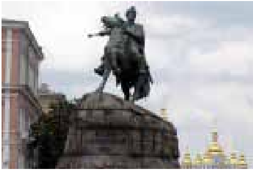
У Києві пам'ятник Хмельницькому... «оживе»