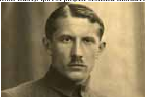
Хроніка Великої Війни

Кадри з фільмів, фотографії картин. Ці зображення становлять окрему групу. Їхній зміст фактично не визначається задумом і майстерністю фотографа, а вже є готовим, видання просто переносить їх на свою сторінку. Ці зображення виконують ілюстративну функцію. За основу нашої класифікації ми взяли об'єкт зйомки. На нашу думку, те, що зображено на фотографії є найважливішим для читача. Фотографії, що репрезентують одну тему, дослідники називають по-різному: фотосерія, фоторепортаж, документальне фото тощо. По-перше, таке визначення робиться на основі кількості фотографій, а не об'єкту зйомки. По-друге, така серія фотографій може складатися з фото, що належать до різних жанрів. По-третє, такі фото рідко зустрічаються в сучасних газетних виданнях, насамперед, через брак площі, а також через те, що їх створення вимагає багато часу і майстерності: не кожен набір фотографій можна назвати фотосерією.