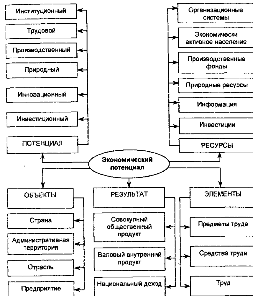
Рис. 4.6. Структура экономического потенциала региона

В существующей экономической теории производственный потенциал определяется как экономический потенциал сферы материального производства, включающий трудовые и материальные ресурсы, задействованные в производственной деятельности. Здесь производственный потенциал определяется наличием производственными ресурсами, используемыми как в сфере материального производства, так и в непроизводственной сфере для производства товаров и услуг как производственного, так и непроизводственного назначения. Содержанием производственного потенциала территории являются задействованные и находящиеся в