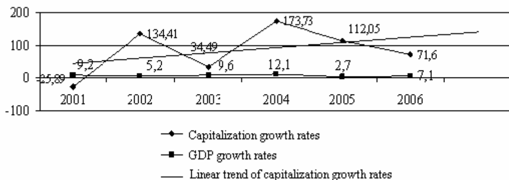
Fig. 2. The rates of growth dynamics of market capitalization and GDP in Ukraine

In comparison with rate of growth of countries' GDP with the maximum meaning 12,1% in 2004 the rates of growth of market capitalization are much greater. Moreover, the indices behavior in different years doesn't correspond with each other. Despite considerable variations in the dynamics of market capitalization index the built linear trend is the evidence of market capitalization growth.