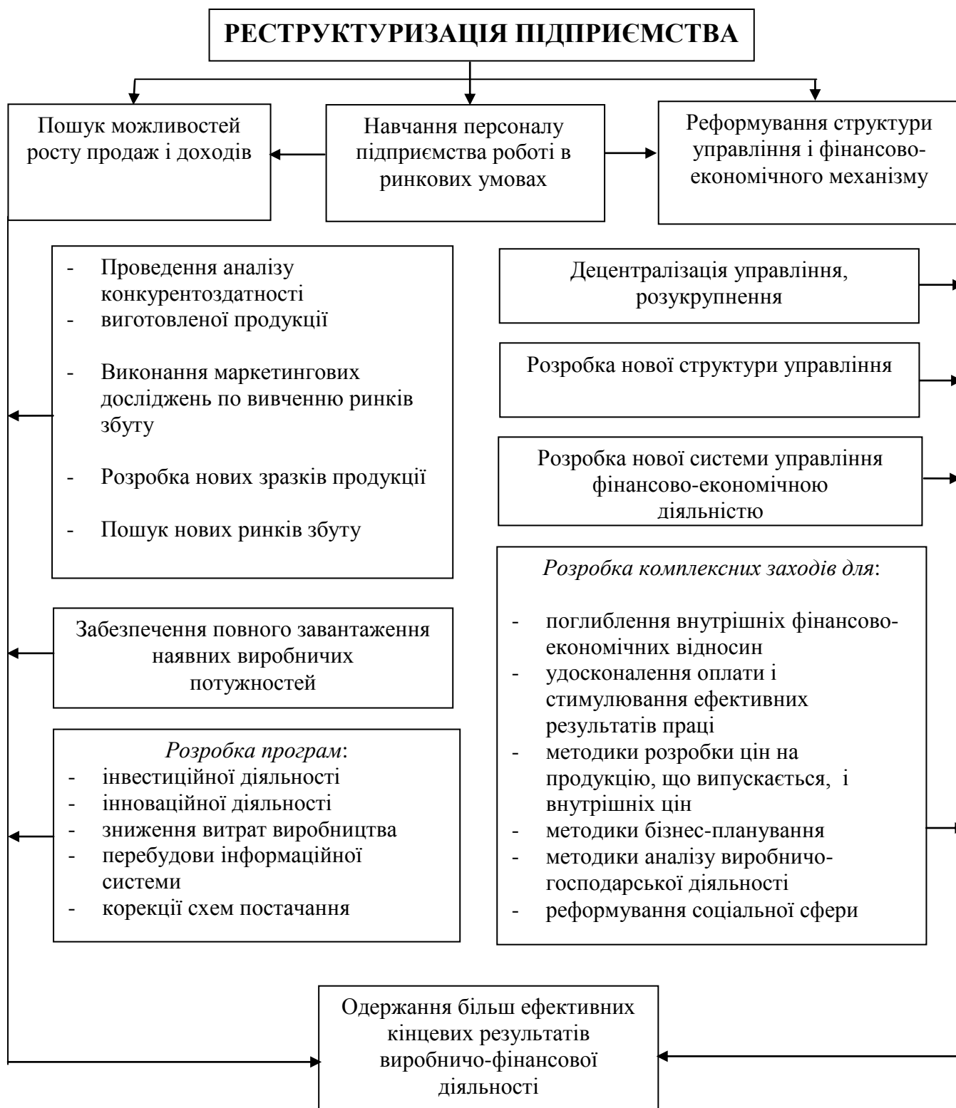
Рис. 2. Схема реструктуризації підприємства