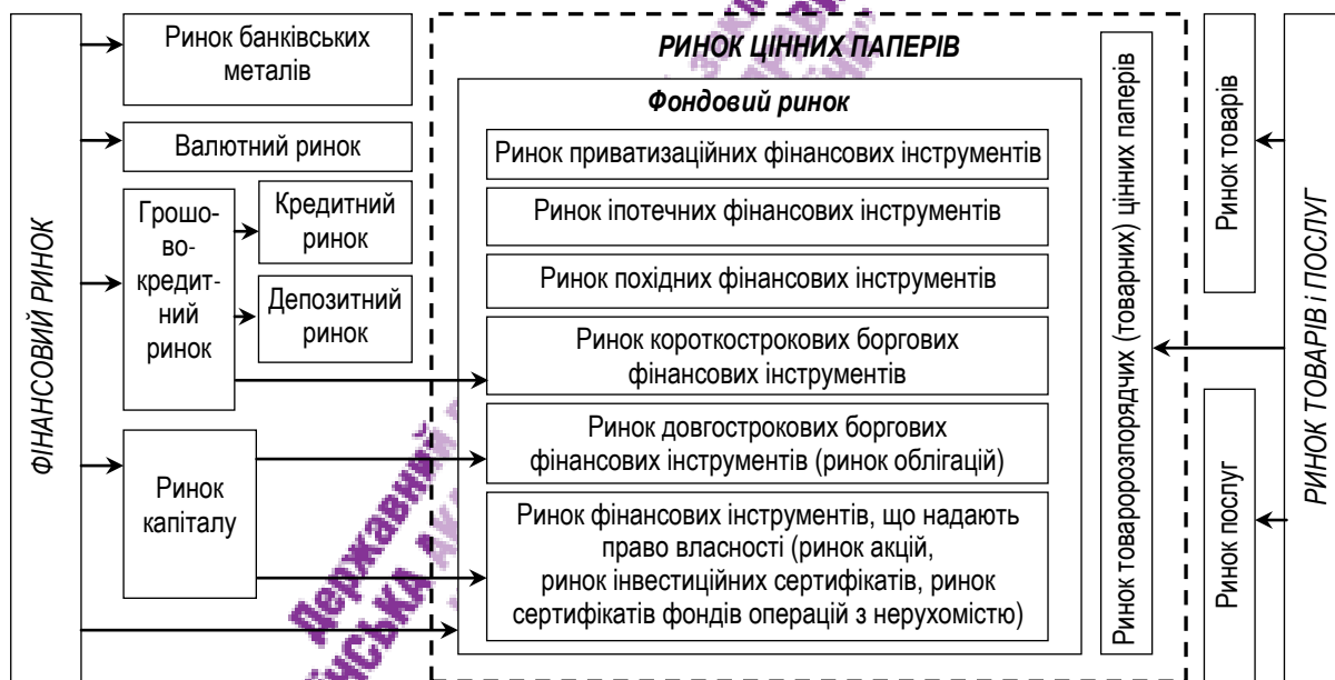
Рисунок 1 – Місце фондового ринку та ринку цінних паперів у просторі взаємодії фінансового ринку та ринку товарів і послуг

У більшості наукових праць та нормативно-правових документах ототожнюються фондовий ринок, ринок цінних паперів, ринок капіталу, причому всі вони виокремлюються у структурі фінансового ринку. На відміну від існуючих підходів, автор пропонує розглядати ринок цінних паперів на перетині фінансового ринку та ринку товарів та послуг (рис. 1).