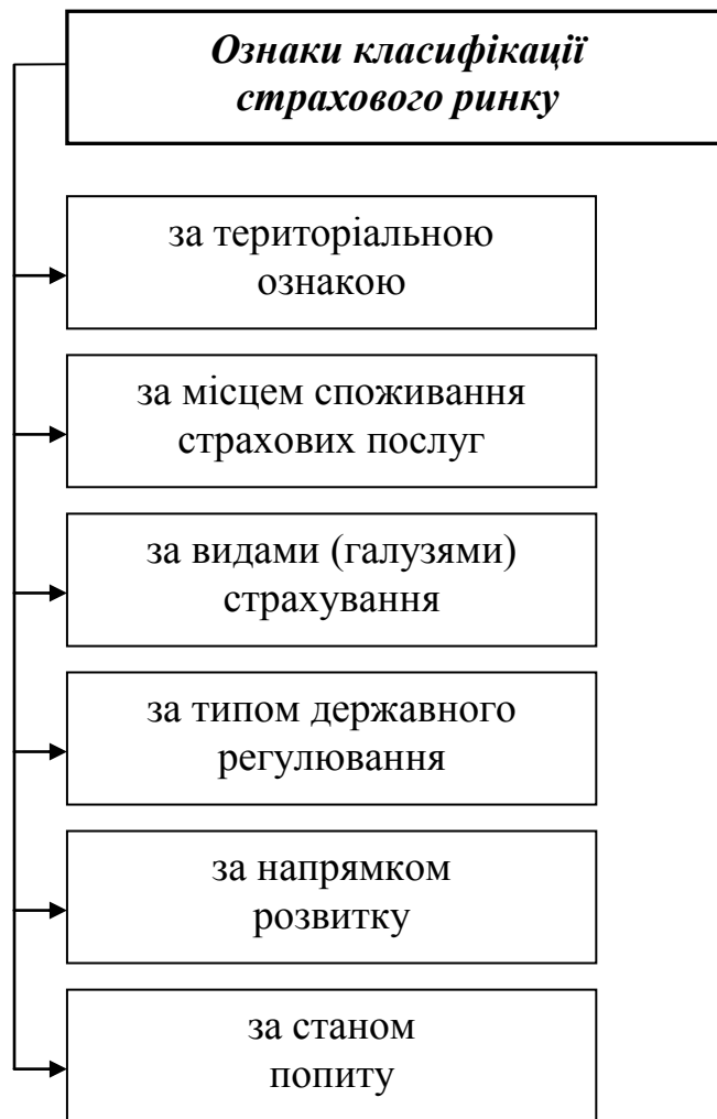
Рис. 1.1. Загальні ознаки класифікації страхового ринку [1]

Крім того, страховий ринок можна поділити за видами страхування: