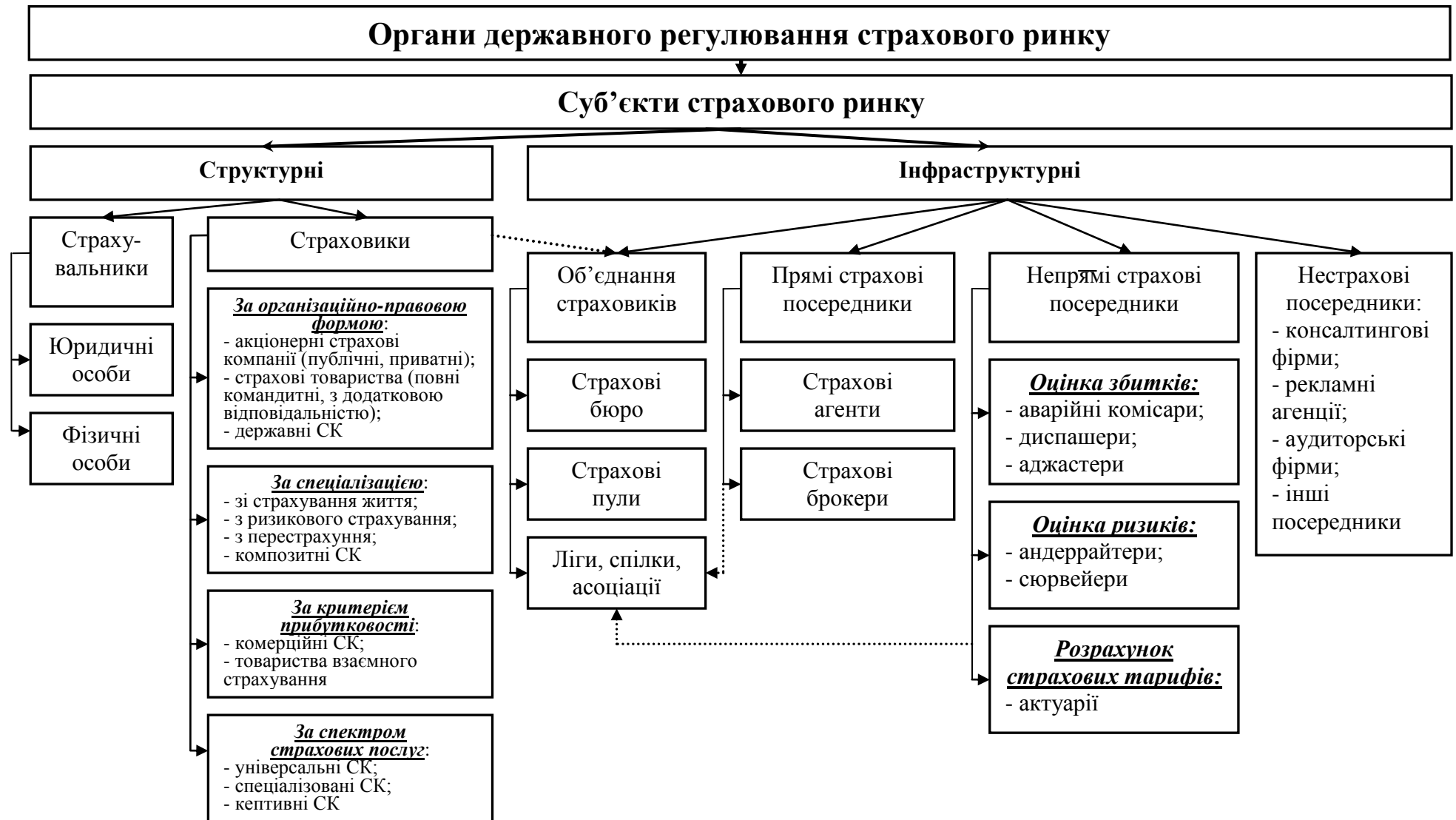
Рис. 1.2. Класифікація учасників страхового ринку